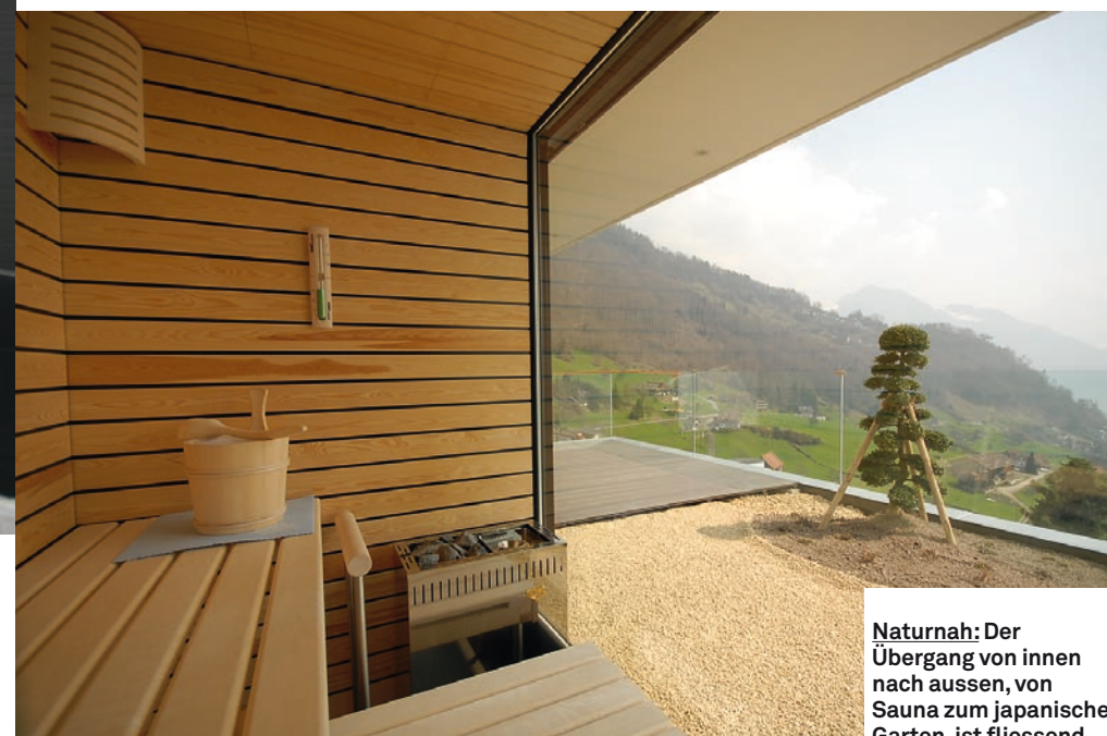
Naturnah: Der Übergang von innen nach aussen, von Sauna zum japanischen Garten, ist fließend.