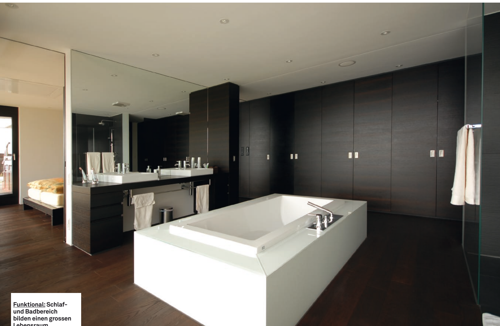
Funktional: Schlaf- und Badbereich bilden einen grossen Lebensraum.